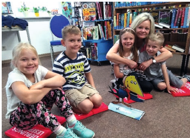
Vorschulkinder aus der Ziegelheimer Kita

Da die Ziegelheimer nur zu viert angereist waren, konnten sie mit Tim und dem Buchstaben-Kobold Linus das ganze Alphabet im ABC-Wimmelbuch suchen. Den Kindern hat es viel Spaß gemacht.