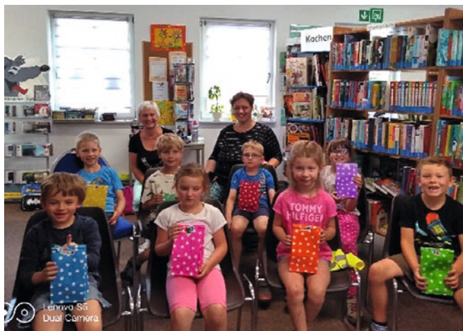
Vorschulkinder aus der Flemminger Kita

An dieser Stelle möchte ich mich ganz herzlich bei der Schnuphase'schen Buchhandlung und der Spielkartenfabrik in Altenburg für die bereitgestellten Bücher und Spiele bedanken.