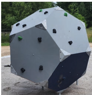
Ein modernes Kletter-Würfelement

Im kleinen Ortsteil mit 183 Einwohnern wohnen derzeit 34 Kinder und Jugendliche aller Altersklassen (Stand: 5. Juli 2022). Im Rahmen der Spielplatzgestaltung wurde daher ein besonderes Augenmerk auf ein breitgefächertes, innovatives und interessantes Angebot gelegt.