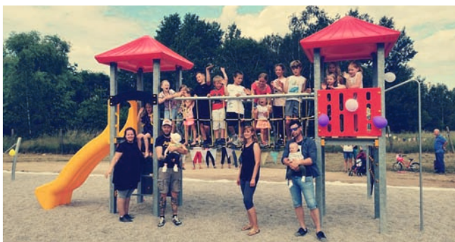
Zur Eröffnungsfeier kamen Groß und Klein zusammen

Reckstangen in verschiedenen Höhen installiert. Dies entsprach auch dem Wunsch der Anwohner.